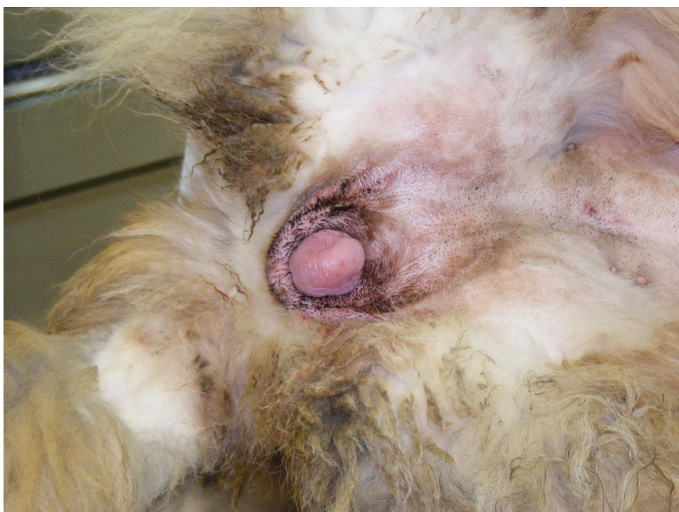
Prolaps nožnične gube pri psici

Terapija je odvisna od razsežnosti vaginalne gube, pa tudi od tega, ali gre za vzrejno psičko in/ali je prolaps prisoten med estrusom ali morda na koncu brejosti.