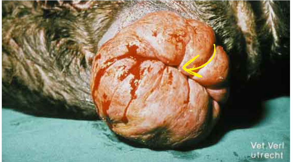
Krožni (cirkumferencialni) prolaps nožnice. Lumen nožnice je označen z rumeno puščico.

Po kirurški terapiji do ponovnega pojava prolapsa nožnične gube pri naslednji gonitvi pride le v 25 %. Kirurška odstranitev ne povzroči zožanja nožnice in zaradi tega ni pričakovati težave pri paritvi in kotitvi.